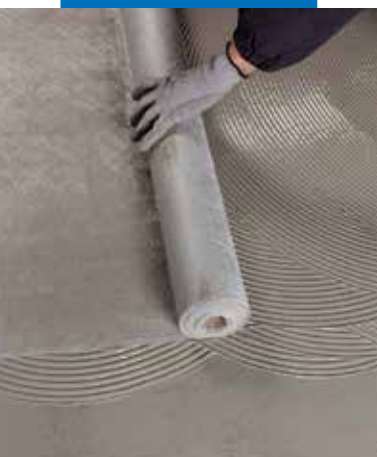
Inserimento di Mapetex Sel nella prima mano di Mapelastico Turbo fresca