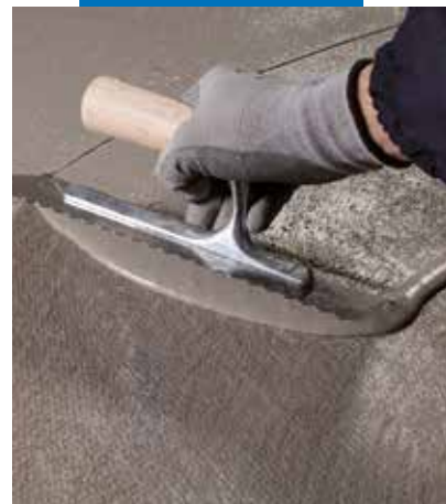
Seconda mano di Mapelastico Turbo su prima armata con Mapetex Sel

Mapelastico Turbo componente A non è considerato pericoloso ai sensi delle attuali normative sulla classificazione delle miscele. Contiene leganti idraulici speciali, che a contatto con sudore o