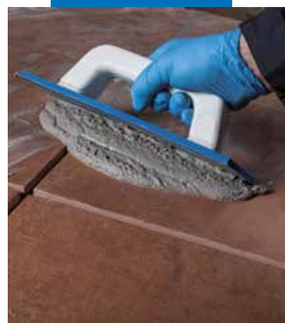
Stuccatura di piastrelle con Ultracolor Plus