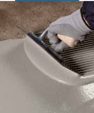
Applicazione della prima mano di Mapelastico Turbo