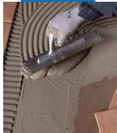
Posa di piastrelle con Elastorapid