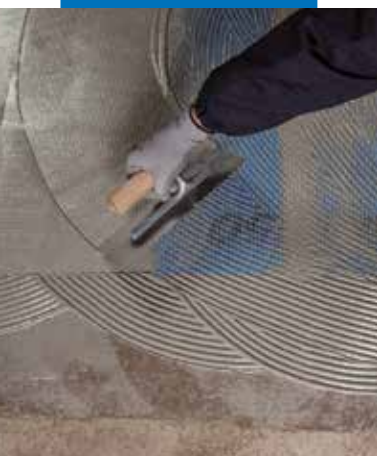
Inserimento di Mapenet 150 nella prima mano di Mapelastico Turbo fresca